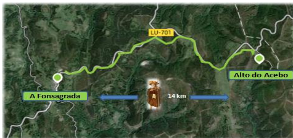
Figura 1. Itinerario del primer tramo: O Acevo – A Fonsagrada.