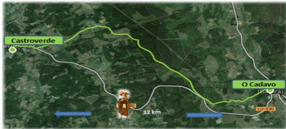
Figura 4. Itinerario del cuarto tramo: O Cádavo – Castroverde.