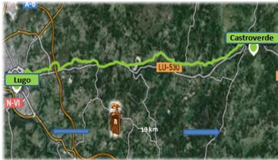
Figura 5. Itinerario del quinto tramo: Castroverde – Lugo.