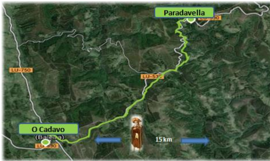
Figura 3. Itinerario del tercer tramo: Paradavella – O Cádavo.